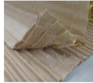
※紙と紙がしっかり粘着

* 梱包物の表面に同じ接着成分が有りますと反応する場合がございます。ご注意ください。